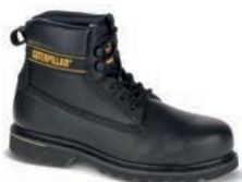
HONEY P708214 Nubuck